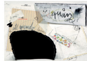
ATE QUANDO? - Colagem s/ papel - 21x29.5 cm - 2004