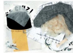
SANTA CRUZ - Colagem s/ papel - 21x29.5 cm - 2004