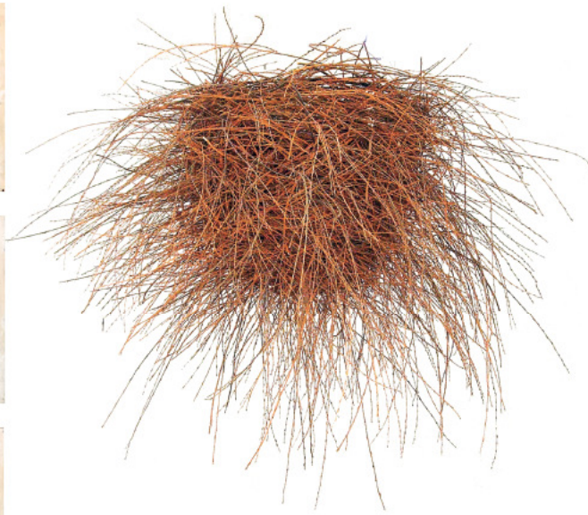
S/ Título - Madeira - 200x200x240 cm - 2003