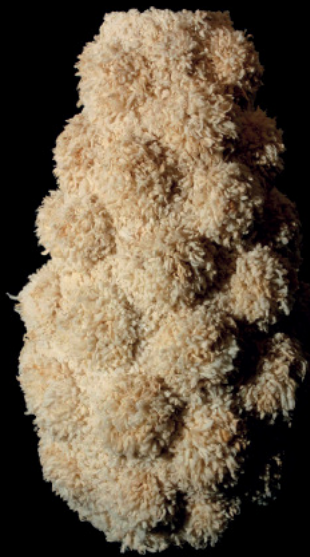
S/ Titulo - Lã de ovelha e algodão - 140x95x95 cm - 2004