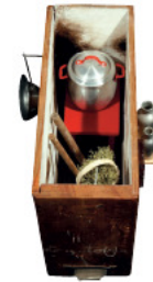
A SEGUIR ÀS AULAS Técnica mista - 19x25x10 cm - 2004