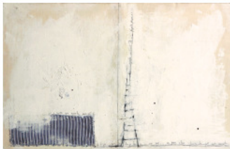
FUGA - Técnica mista s/ madeira - 29x45 cm - 2003