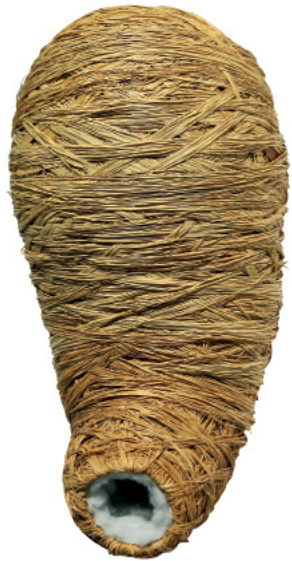
S/ título - Ráfia e Algodão - 98x58x45 cm - 2003