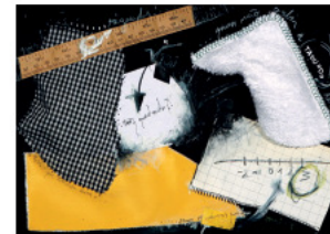
ERA COMPLICADO! - Colagem s/ papel - 21x29.5 cm - 2004