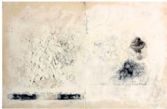
BANDERA VERMELHA - Técnica mista s/ madeira - 29x45 cm - 2003