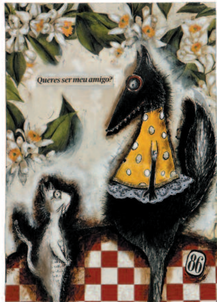
QUERES SER MEU AMIGO?; técnica mista s/papel, 29,5x21 cm, 2008