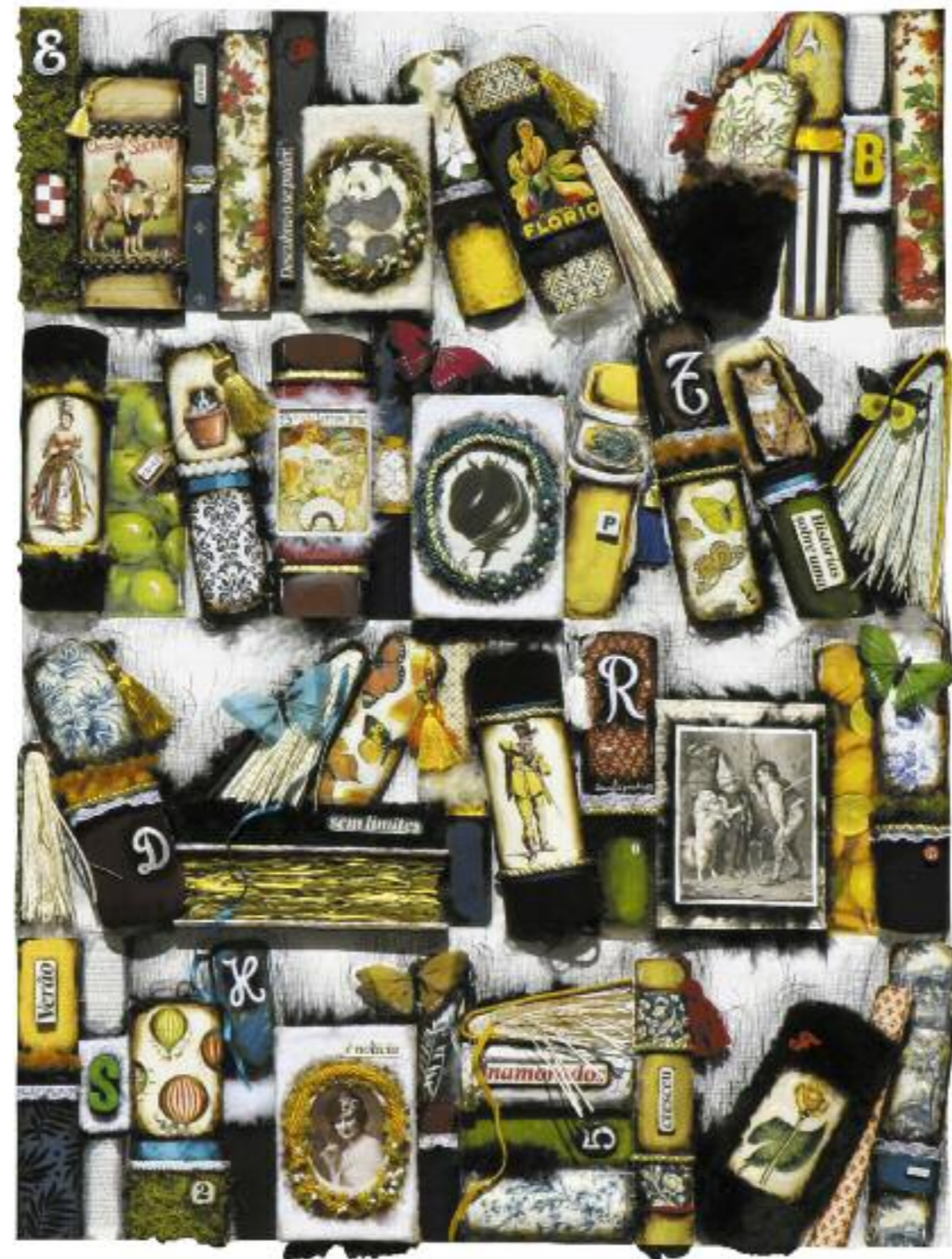
S/TÍTULO; técnica mista s/papel, 136x100 cm, 2008