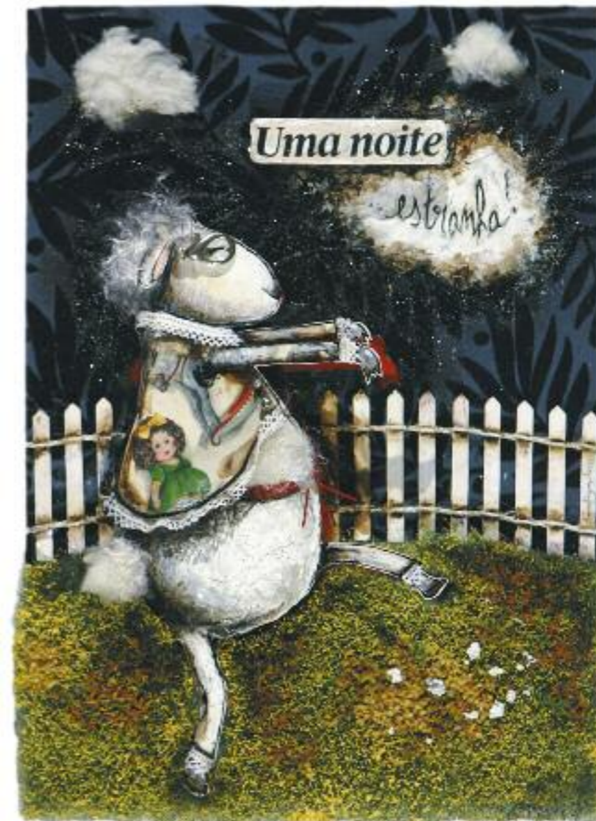
UMA NOITE ESTRANHA!; técnica mista s/papel, 29,5x21 cm, 2008