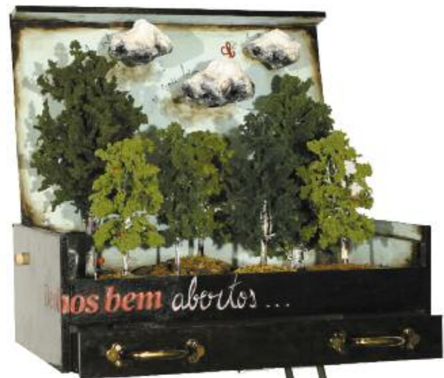
QUEM TEM MEDO DO LOBO MAU?; técnica mista s/madeira 167x75x50cm, 2008